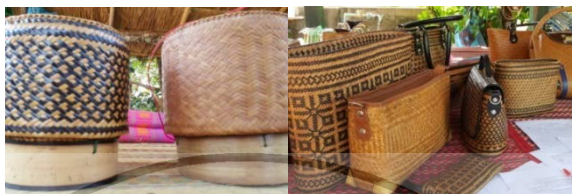
ภาพที่ 1 กระจับข้าวเหนียวและกระจับเป่าสตรีจากคล้า

ต้นทุนการผลิตกระจับข้าวเหนียว จากการค้นคว้า กรณีศึกษา กลุ่มจักสานกระจับคล้า ในเขตอำเภอศรีบุญเรือง จังหวัดหนองบัวลำภู สรุปว่ากลุ่มผลิตภัณฑ์จักสานกระจับข้าวเหนียวจากคล้า โดยแบ่งเป็นเขตตำบลทรายทอง และตำบลกุดสะเทียน ปริมาณการผลิต 80-100 ใบ/คน/เดือน ราคาขายส่ง 65 -80 -90 บาท ตามขนาด เล็ก กลาง ใหญ่ ราคาขายปลีกตามแหล่งจำหน่าย 120-140-160 บาท รูปแบบผลิตภัณฑ์เป็นแบบผลิตภัณฑ์หลักที่จำหน่ายเป็นกระจับข้าวพื้นฐาน ไม่นิยมย้อมสี วัสดุชิ้นส่วนประกอบด้วย ก้านตาล โครงไม้ไผ่ ตอกคล้า เชือกไนลอน