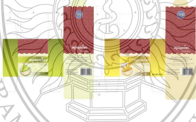
ภาพที่ 3 แบบแผ่นศิลป์โครงสร้างบรรจุภัณฑ์สำหรับสบู่มุนไพร์ บ้านโรงช้าง จังหวัดสิงห์บุรี