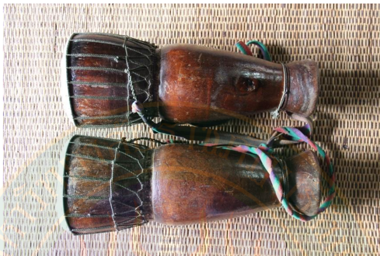
ภาพที่ ๙ กลองกันตรึม