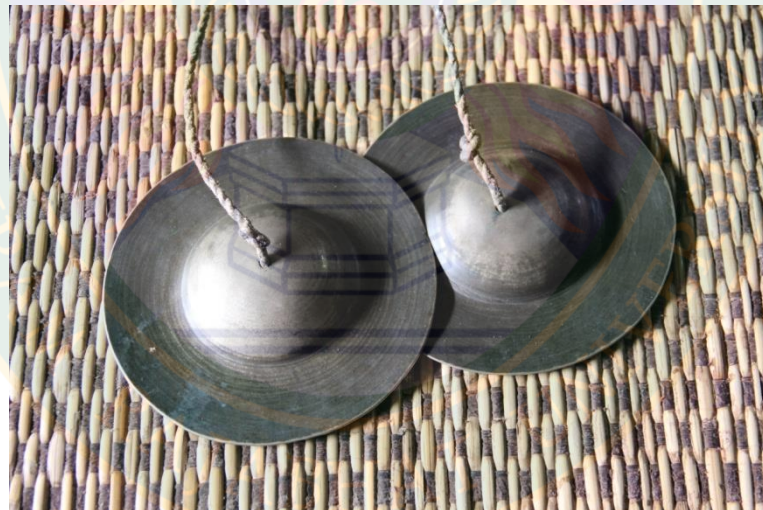
ภาพที่ ๑๒ ฉาบ ที่มา: พิษชาณัฐ ตู้อินดา (๒๒ มิถุนายน พ.ศ. ๒๕๕๖)