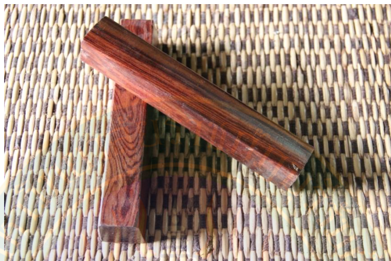
ภาพที่ ๑๓ กriebไม้ (กriebเสภา)