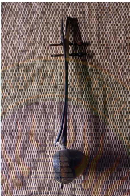
ภาพที่ ๕ ตระวัทม (ซอด้วง) ที่มา: พิษชาณัฐ ตู้อินดา (๒๒ มิถุนายน พ.ศ. ๒๕๕๖)