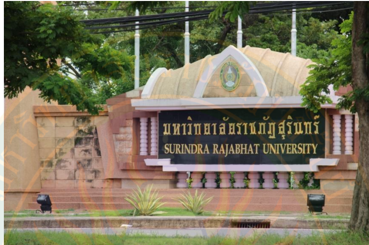
ภาพที่ ๔๕ ป้ายหน้าทางเข้ามหาวิทยาลัยราชภัฏสุรินทร์ ที่มา: พิชชาณัฐ ตู้อินดา (๒๒ มิถุนายน พ.ศ. ๒๕๕๖)