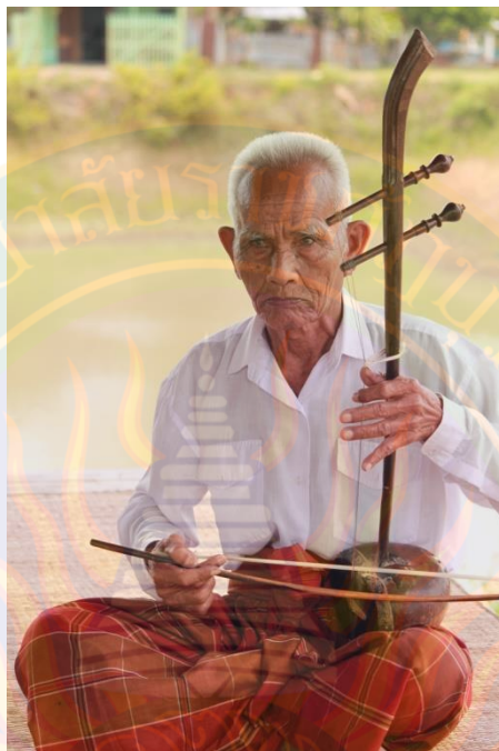
ภาพที่ ๑๔ แสดงท่านั่งและลักษณะการบรรเลงตรัว