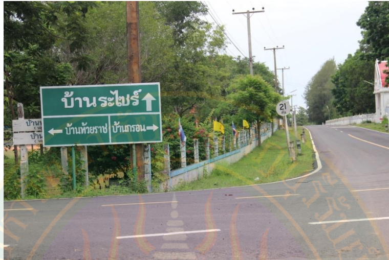
ภาพที่ ๔๙ ป้ายทางเข้าหมู่บ้านระไทร์ ตำบลเจนีง อำเภอเมือง จังหวัดสุรินทร์ ที่มา: พิชชาณัฐ ตูจินดา (๒๒ มิถุนายน พ.ศ. ๒๕๕๖)