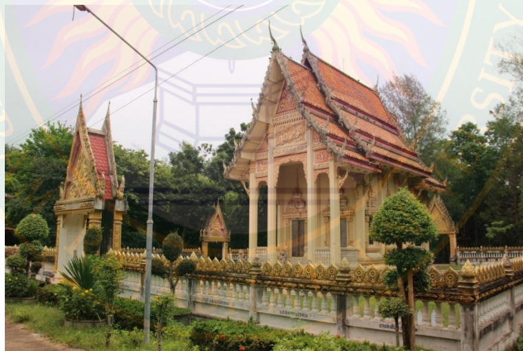
ภาพที่ ๕๐ พระอุโบสถวัดนาสม ที่มา: พิชชาณัฐ ตูจินดา (๒๒ มิถุนายน พ.ศ. ๒๕๕๖)