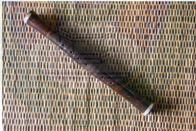
ภาพที่ ๘ ปี่ใน (ปี่ใน)