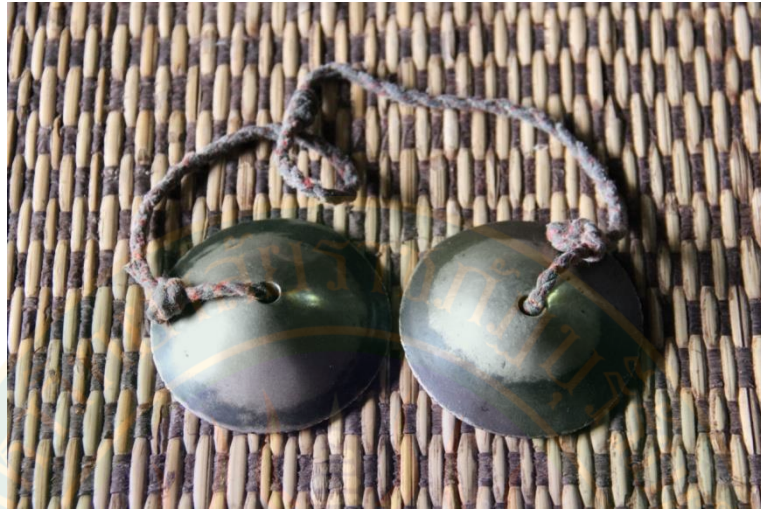
ภาพที่ ๑๑ ฉิ่งสำริด ที่มา: พิษชาณัฐ ตู้อินดา (๒๒ มิถุนายน พ.ศ. ๒๕๕๖)