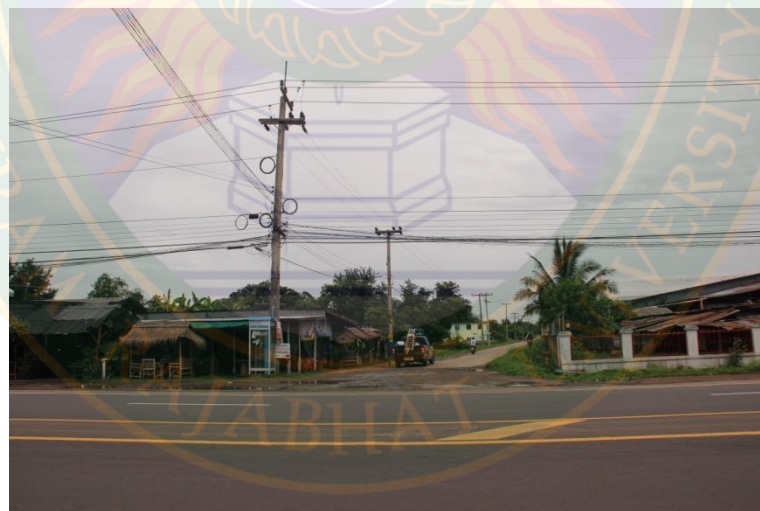
ภาพที่ ๔๘ ปากซอยทางเข้าหมู่บ้านระไซร์ ตำบลเจนีง อำเภอเมือง จังหวัดสุรินทร์