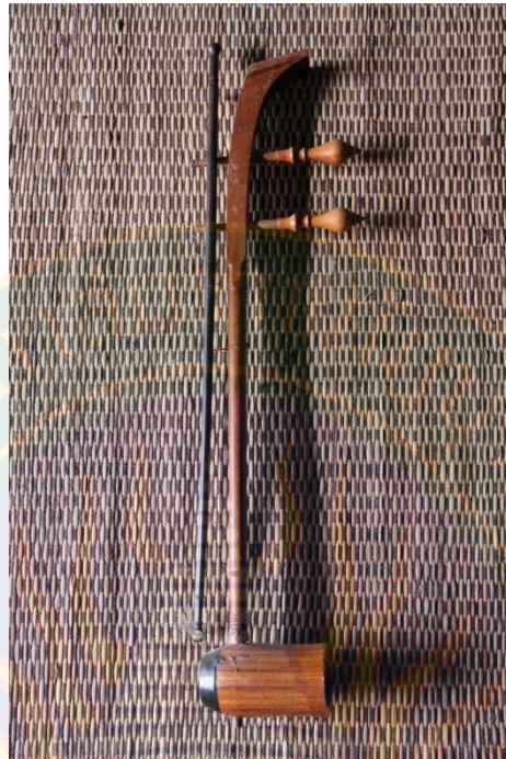
ภาพที่ ๗ ซอด้วง (ซอด้วง) ที่มา: พิษชาณัฐ ตู้อินดา (๒๒ มิถุนายน พ.ศ. ๒๕๕๖)