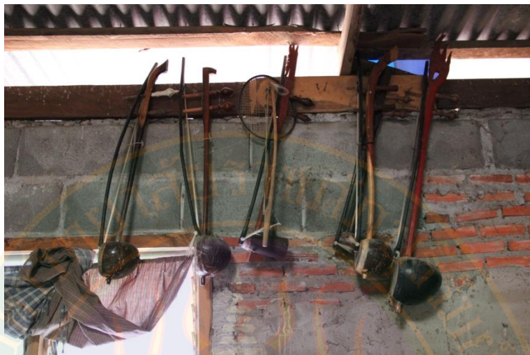
ภาพที่ ๕๗ ตระวัชนิตต่างๆ ภายในบ้านนายเผย ศรีสวาท