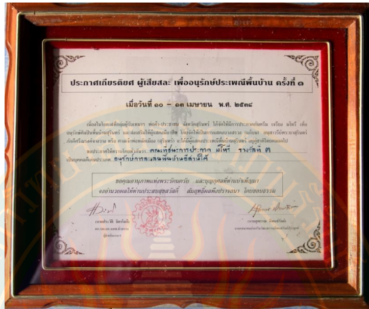
ภาพที่ ๓๓ เกียรติบัตรรางวัลรองชนะเลิศอันดับ ๒ ประกวดวงมโหรีพื้นบ้าน บุคคลดีเด่นประเภทอนุรักษ์การเล่นพื้นบ้านอีสานใต้ ในงานอนุรักษ์ศิลปพื้นบ้าน จังหวัดสุรินทร์ ครั้งที่ ๑ ปี พ.ศ. ๒๕๓๘ ที่มา: พิชชาณัฐ ตู้อินดา (๒๒ มิถุนายน พ.ศ. ๒๕๕๖)