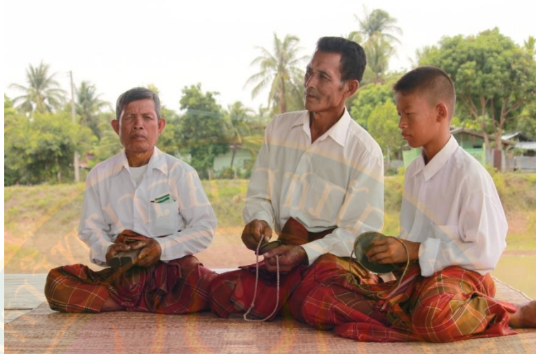
ภาพที่ ๑๘ แสดงทำนองและลักษณะการบรรเลงเครื่องประกอบจังหวะ (กรับไม้ ฉิ่ง ฉาบเล็ก)