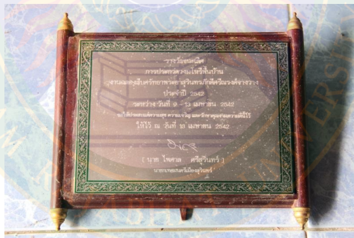
ภาพที่ ๓๔ โล่เกียรติคุณรางวัลชนะเลิศประกวดวงมโหรีพื้นบ้าน ในงานฉลองสี่ศรัทธา พระยาสุรินทร์ภักดีศรีณรงค์จางวาง ประจำปี พ.ศ. ๒๕๔๒ ระหว่างวันที่ ๙-๑๓ เมษายน พ.ศ. ๒๕๔๒ ที่มา: พิชชาณัฐ ตู้อินดา (๒๒ มิถุนายน พ.ศ. ๒๕๕๖)