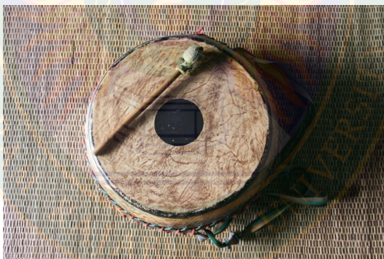
ภาพที่ ๑๐ กลองสองหน้า (กลองใหญ่) พร้อมไม้ตี ที่มา: พิษชาณัฐ ตู๋จินดา (๒๒ มิถุนายน พ.ศ. ๒๕๕๖)