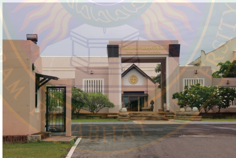
ภาพที่ ๔๖ พิพิธภัณฑสถานแห่งชาติสุรินทร์ ที่มา: พิชชาณัฐ ตู้อินดา (๒๒ มิถุนายน พ.ศ. ๒๕๕๖)