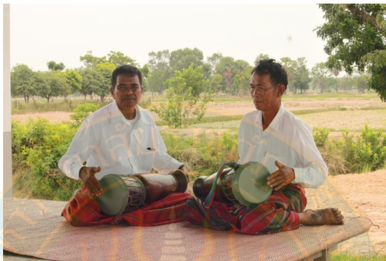
ภาพที่ ๑๖ แสดงทำนองและลักษณะการบรรเลงกลองกันตรึม ที่มา: พิษชาณัฐ ตู้อินดา (๒๔ เมษายน พ.ศ. ๒๕๕๕)