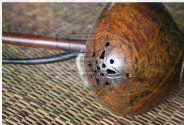
ภาพที่ ๖ ลักษณะกะโหลกและลายตระวัทม ที่มา: พิษชาณัฐ ตู้อินดา (๒๒ มิถุนายน พ.ศ. ๒๕๕๖)