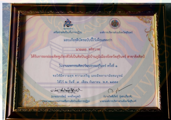
ภาพที่ ๓๖ เกียรติบัตรยกย่องเชิดชูเกียรติให้เป็นศิลปินภูมิบ้านภูมิเมืองจังหวัดสุรินทร์ สาขาศิลปะ จากเครือข่ายศิลปินเพื่อการปฏิรูปและองค์การบริหาร- ส่วนจังหวัดสุรินทร์ ในงานมหกรรมศิลปวัฒนธรรมสุรินทร์ ครั้งที่ ๑ ณ วันที่ ๗ กันยายน พ.ศ. ๒๕๕๕