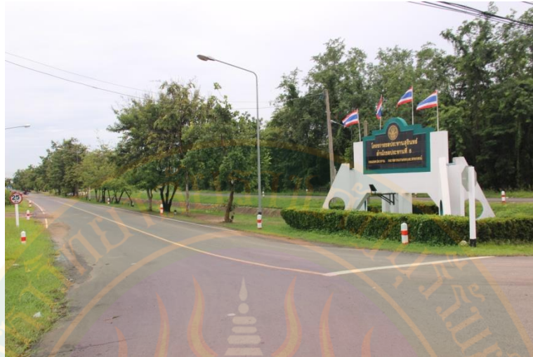
ภาพที่ ๔๗ โครงการชลประทานสุรินทร์ สำนักชลประทานที่ ๘ กรมชลประทาน กระทรวงเกษตรและสหกรณ์