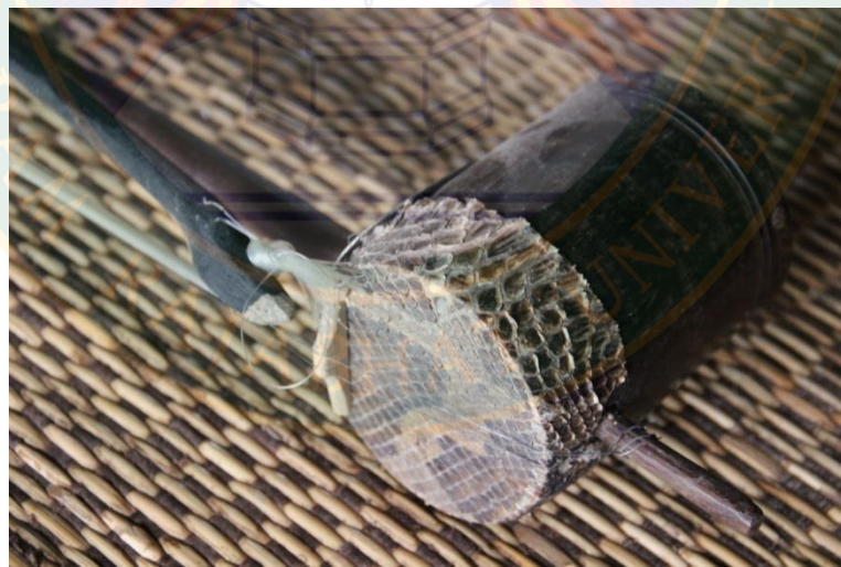
ภาพที่ ๒ ลักษณะกระบอกและหน้าตรึงกลาง หมายเลข ๑ ที่มา: พิษชาณัฐ ตู้อินดา (๒๒ มิถุนายน พ.ศ. ๒๕๕๖)