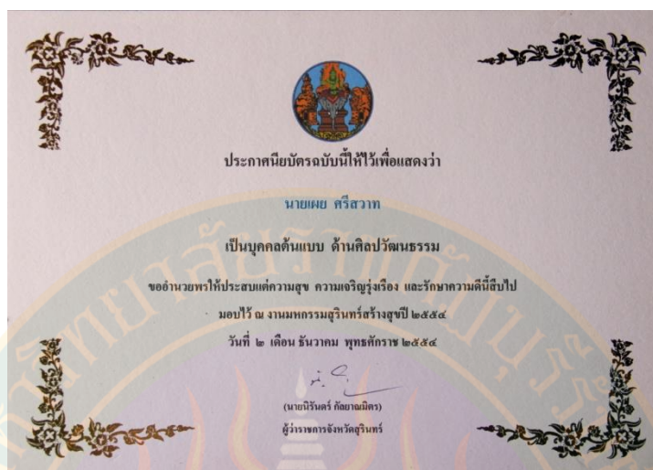
ภาพที่ ๓๕ เกียรติบัตรรางวัลบุคคลต้นแบบด้านวัฒนธรรม งานมหกรรมสุนทรียรสร้างสุข ปี ๒๕๕๔ วันที่ ๒ ธันวาคม พ.ศ. ๒๕๕๔