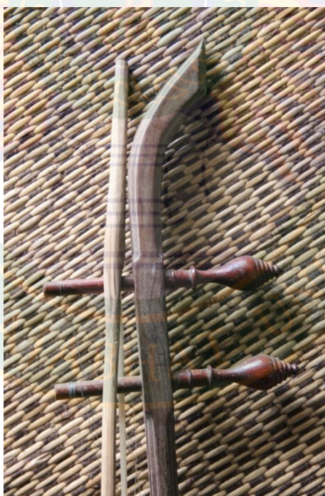
ภาพที่ ๔ ลักษณะโชนและลูกบิดตรวกลาง หมายเลข ๒ ที่มา: พิชชาณัฐ ตูจันดา (๒๒ มิถุนายน พ.ศ. ๒๕๕๖)