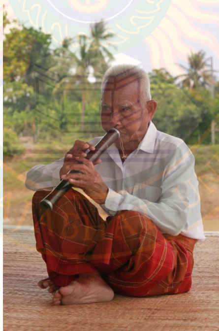
ภาพที่ ๑๕ แสดงท่านั่งและลักษณะการบรรเลงปี่สไล (ปี่ใน)