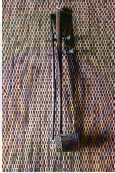
ภาพที่ ๑ ตรึงกลาง หมายเลข ๑