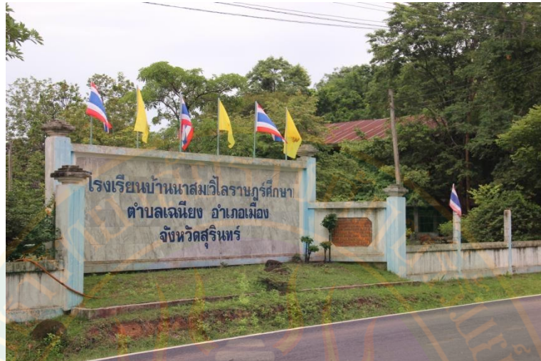
ภาพที่ ๕๑ โรงเรียนวัดนาสม (วิไลราษฎร์ศึกษา) ที่มา: พิชชาณัฐ ตู้อินดา (๒๒ มิถุนายน พ.ศ. ๒๕๕๖)