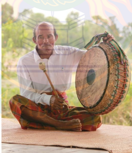
ภาพที่ ๑๗ แสดงทำนองและลักษณะการบรรเลงกลองสองหน้า (กลองใหญ่)