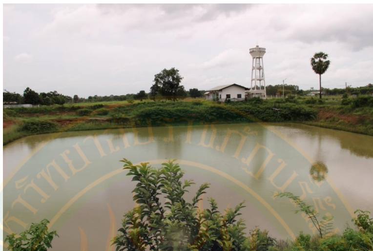
ภาพที่ ๕๓ สระน้ำประจำหมู่บ้านระไซร์ ตำบลเจนีง อำเภอเมือง จังหวัดสุรินทร์ ที่มา: พิชชาณัฐ ตูจันดา (๒๒ มิถุนายน พ.ศ. ๒๕๕๖)