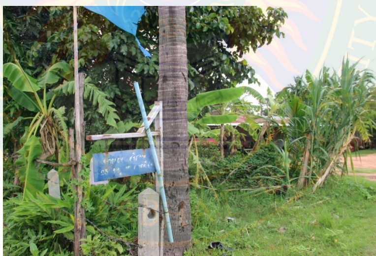
ภาพที่ ๕๔ ป้ายทางเข้าบ้านพักอาศัยนายเผย ศรีสวาท ที่มา: พิชชาณัฐ ตูจันดา (๒๒ มิถุนายน พ.ศ. ๒๕๕๖)