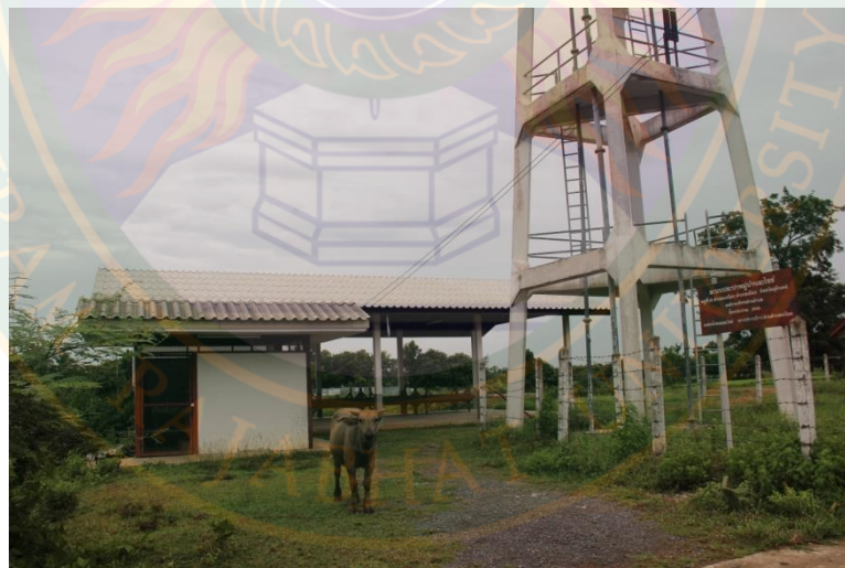
ภาพที่ ๕๒ ระบบประปาหมู่บ้านระไซร์