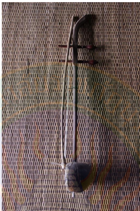
ภาพที่ ๓ ตรวกลาง หมายเลข ๒ ที่มา: พิชชาณัฐ ตูจันดา (๒๒ มิถุนายน พ.ศ. ๒๕๕๖)