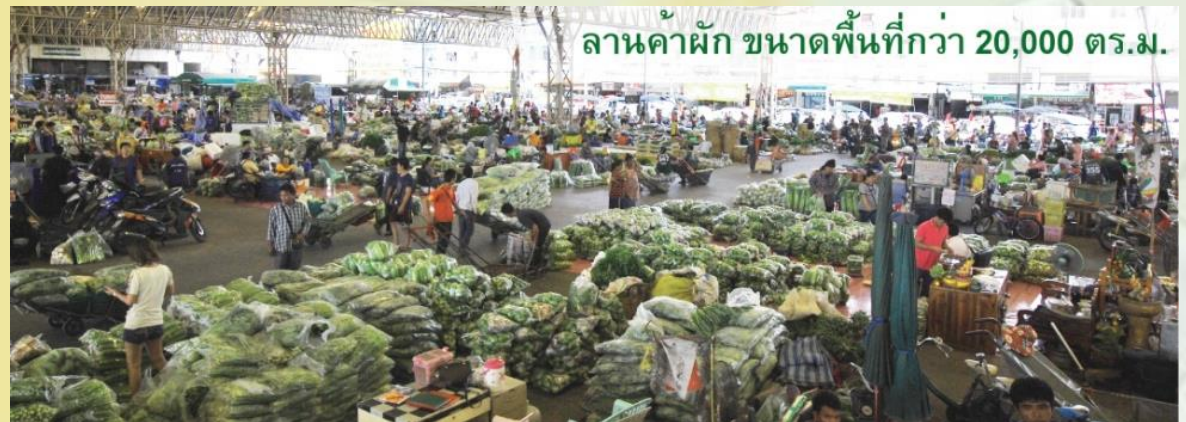
ลานค้าผัก ขนาดพื้นที่กว่า 20,000 ตร.ม.