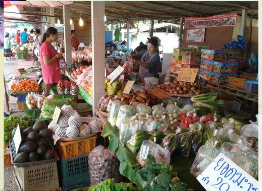
การตลาดเกษตร อ.เลิศภูมิ จันทบุรีเพ็ญกุล