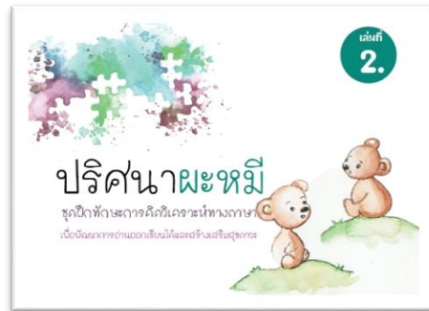
ชุดฝึก เล่ม 2

ปริศนาหมี ชุดฝึกทักษะ การคิดวิเคราะห์ทางภาษา ฯ เล่ม 1 เป็นปริศนาเกี่ยวกับ มาตราตัวสะกด