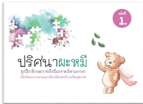
ชุดฝึก เล่ม 1

ชุดฝึกทักษะการคิดวิเคราะห์ทางภาษา เพื่อพัฒนาการอ่านออกเขียนได้และสร้างเสริมสุขภาวะ