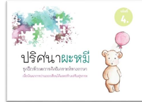
ชุดฝึก เล่ม 4

ปริศนาหมี ชุดฝึกทักษะ การคิดวิเคราะห์ทางภาษา ฯ เล่ม 3 เป็นปริศนาที่มี พยางค์แรก หรือพยางค์หลัง เป็นคำที่มีเสียงเหมือนกัน