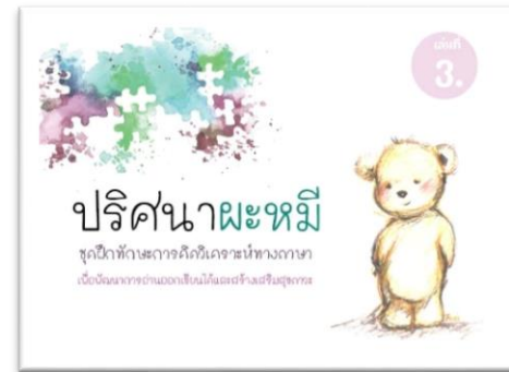
ชุดฝึก เล่ม 3

ปริศนาหมี ชุดฝึกทักษะ การคิดวิเคราะห์ทางภาษา ฯ เล่ม 2 เป็นปริศนาเกี่ยวกับ อักษรนำและคำควบกล้ำ