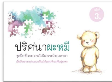
ชุดฝึก เล่ม 3

ปริศนาหมี ชุดฝึกทักษะ การคิดวิเคราะห์ทางภาษา ฯ เล่ม 2 เป็นปริศนาเกี่ยวกับ อักษรนำและคำควบกล้ำ