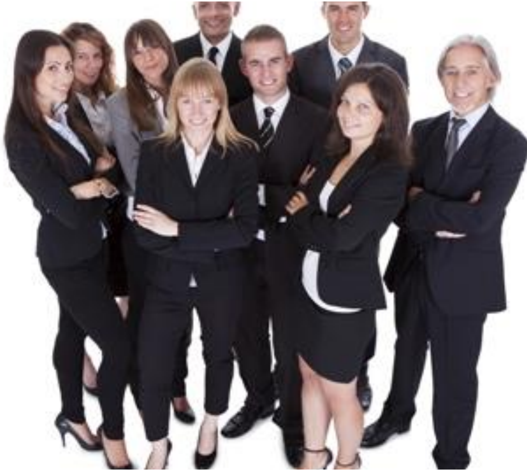
วัฒนธรรมขององค์กร

ได้แก่ การสร้างค่านิยมบรรทัดฐานและความเชื่อกันของสมาชิกในองค์กรทำให้องค์กรจะพัฒนาเป็นวัฒนธรรมเดียวกัน