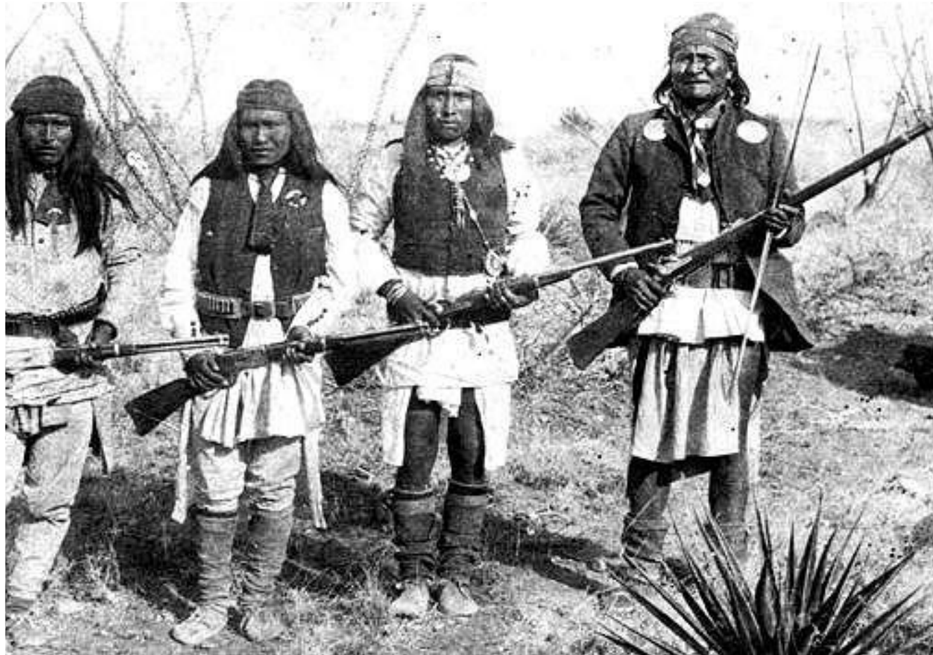
วัฒนธรรมของชนชาติ

ได้แก่ การสร้างค่านิยมและ เป็นความเชื่อร่วมกันของผู้คน ในแต่ละชาติ นอกจากนี้อาจ รวมถึงเผ่าพันธุ์ชนชาติและ วัฒนธรรมที่เป็น เอกลักษณ์ด้วย