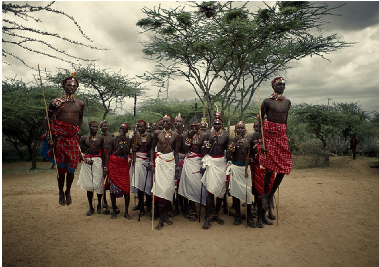
กลุ่มวัฒนธรรมของเผ่าพันธุ์หรือกลุ่มบางชนชาติ

เช่น สหรัฐอเมริกา แคนาดา อินโดนีเซีย มีวัฒนธรรมย่อย ๆ มากมาย ความแตกต่างของ วัฒนธรรมเผ่าพันธุ์และศาสนา ของกลุ่มเป็นส่วนหนึ่งของ วัฒนธรรม