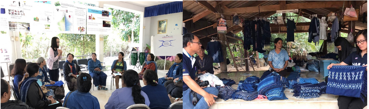
ภาพที่ 1 นักวิจัยและชุมชนร่วมกันค้นหาเอกลักษณ์ชุมชน

3. แนวทางการพัฒนาศักยภาพในสร้างเอกลักษณ์ของสินค้าเพื่อสร้างความเข้มแข็งของชุมชนอย่างยั่งยืน กลุ่มทอผ้าอ้อมคราม แนวทางในการพัฒนาศักยภาพชุมชน มีดังนี้ 1) การศึกษาบริบทของชุมชนที่จะนำมาสร้างเป็นเอกลักษณ์ 2) จัดเวทีเพื่อค้นหาความต้องการที่แท้จริงที่ได้จากกระบวนการมีส่วนร่วมของชุมชน 3) การตัดสินใจเลือกรูปแบบที่จะนำมาสร้างเป็นเอกลักษณ์สินค้า 4) การนำรูปแบบที่เลือกไปสร้างเป็นโมเดลตัวอย่าง 5) การพัฒนาเอกลักษณ์ด้วยการนำโมเดลตัวอย่างที่ได้ไปทดลองในผืนผ้า และ 6) การขอจดทะเบียนสิทธิบัตรการออกแบบลายผ้า “ลายหมากก่อ”