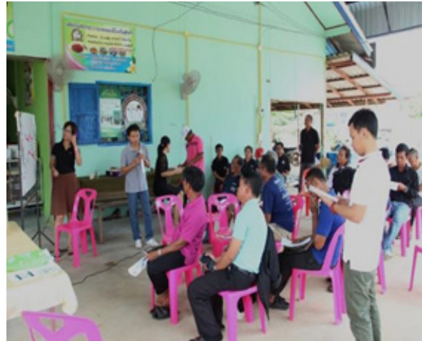
ภาพที่ 2 วิเคราะห์สถานการณ์เพื่อหาแนวปฏิบัติที่เหมาะสมในการจัดการป่าชุมชนอย่างมีส่วนร่วมของชุมชนตำบลศรีณรงค์