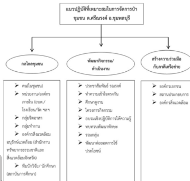
ภาพที่ 4 แนวปฏิบัติที่เหมาะสมในการจัดการทรัพยากรป่าของชุมชน ของตำบลศรีณรงค์ อำเภอชุมพลบุรี จังหวัดสุรินทร์

ผลลัพธ์ที่เกิดกับชุมชน ได้แก่ ได้แนวปฏิบัติที่เหมาะสมในการจัดการทรัพยากรป่าของชุมชนตามบริบทพื้นที่ มีเครือข่ายความร่วมมือทั้งภายในชุมชนและองค์กรภายนอก ได้ความรู้และองค์ความรู้จากการร่วมวิจัย ส่วนผลลัพธ์ที่เกิดให้กับนักวิจัย ส่งเสริมและกระตุ้นให้นักวิจัยของมหาวิทยาลัย ทำงานเพื่อชุมชนร่วมกัน เป็นการส่งเสริมให้นักวิจัยให้เกิดเครือข่าย ความสัมพันธ์ระหว่างนักวิจัยและชุมชน เป็นการสร้างและค้นหาค้นหาองค์ความรู้ที่สามารถนำไปปรับใช้ในพื้นที่อื่น ๆ ได้ และได้รับความรู้จากพื้นที่ เช่น กระบวนการสร้างกฎกติกาชุมชน การขับเคลื่อนนโยบายโดยเชื่อมโยงกับวิถีชุมชน วัฒนธรรมประเพณี ดังภาพที่ 4