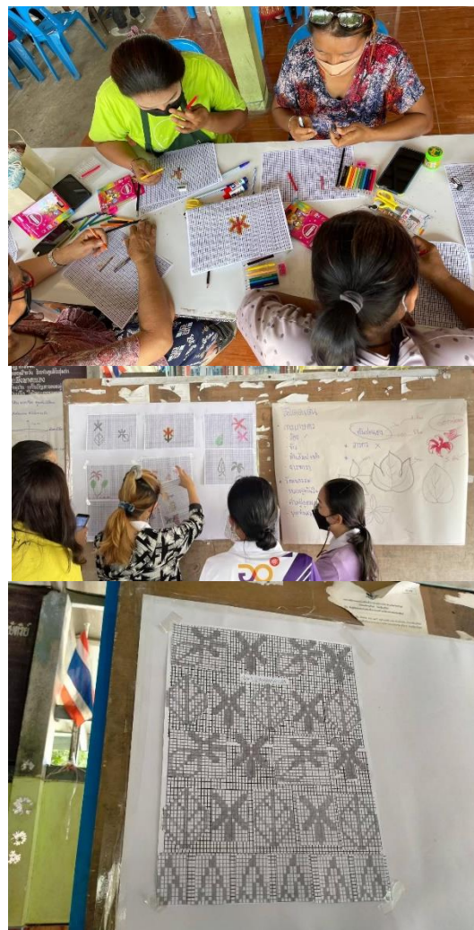
กิจกรรมออกแบบลายผ้าไหม

ภายใต้ “งานราชภัฏบุรีรัมย์มหกรรมวิชาการและวัฒนธรรมนานาชาติครั้งที่ ๕”