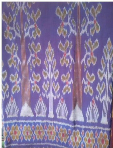
ขั้นตอนการผลิตปัก ดอกปอแดง