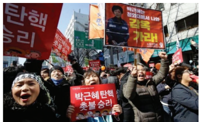
กรณีการขับไล่ประธานาธิบดี ปัก กึน-เฮ จากกรณีเรียกรับผลประโยชน์

๑) ประเทศเกาหลีใต้ เกาหลีใต้ถือเป็นประเทศหนึ่งที่มีประสิทธิภาพสำเร็จ ในด้านของการป้องกันและปราบปรามการทุจริต แต่ก็ยังคงมีปัญหาการทุจริตเกิดขึ้น อยู่บ้าง เช่น เมื่อปี พ.ศ. ๒๕๕๙ มีข่าวกรณีของประธานาธิบดีถูกปลดออกจากตำแหน่ง เพราะเข้าไปมีส่วนเกี่ยวข้องในการเอื้อประโยชน์ให้พวกพ้อง โดยการถูกกล่าวหาว่า ให้เพื่อนสนิทของครอบครัวเข้ามาแทรกแซงการบริหารประเทศ รวมถึงใช้ความสัมพันธ์ ที่ใกล้ชิดกับประธานาธิบดีแสวงหาประโยชน์ส่วนตัว ผลที่เกิดขึ้นคือถูกดำเนินคดีและตั้งข้อหา ว่าพัวพันการทุจริตและใช้อำนาจหน้าที่ ในทางมิชอบเพื่อเอื้อผลประโยชน์ให้แก่พวกพ้อง กรณีที่เกิดขึ้นนี้ประชาชนเกาหลีใต้ได้มีการ รวมตัวกันประท้วงกว่าพันคนเรียกร้องให้ ประธานาธิบดีคนดังกล่าวลาออกจากตำแหน่ง หลังมีเหตุอื้อฉาวทางการเมือง