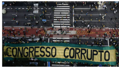
กรณีการชุมนุมขับไล่ประธานาธิบดีดิลมา รุสเซฟที่ จากช็อกล่าวหาทุจริต

๒) ประเทศบราซิล ปลายปี พ.ศ. ๒๕๕๙ ประชาชนในประเทศบราซิล ได้มีการชุมนุมประท้วงการทุจริตที่เกิดขึ้น เป็นการแสดงออกถึงความไม่พอใจต่อวัฒนธรรม การโกงของระบบราชการของประเทศ โดยมีประชาชนจำนวนหลายหมื่นคน เข้าร่วมการชุมนุมในครั้งนี้ และมีการแสดงภาพหนู เพื่อเป็นสัญลักษณ์ในการประณาม ต่อนักการเมืองที่ทุจริตการประท้วงดังกล่าว ยังถือว่ามิขนาดเล็กว่ครั้งก่อน เพราะที่ผ่านมา ได้มีการทุจริตเกิดขึ้นและมีการประท้วง จนในที่สุด ประธานาธิบดีได้ ถูกปลดจากตำแหน่ง เนื่องจากการกระทำที่ละเมิดต่อกฎระเบียบเรื่องงบประมาณ