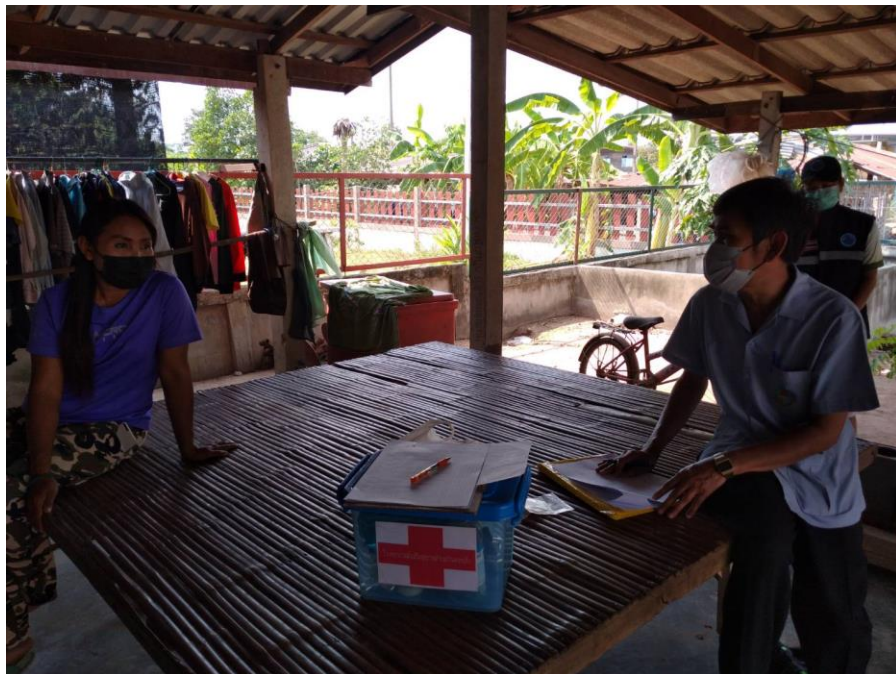
ภาพที่ 17 ผู้วิจัยสัมภาษณ์เชิงลึกกลุ่มตัวอย่างเพื่อประเมินความสำเร็จของผลการดำเนินการวิจัย