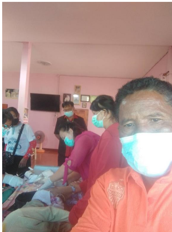
ภาพที่ 5 การให้บริการรักษาพยาบาลผู้ป่วยจิตเภทที่บ้านโดยคณะผู้วิจัยและทีมสหสาขาวิชาชีพ