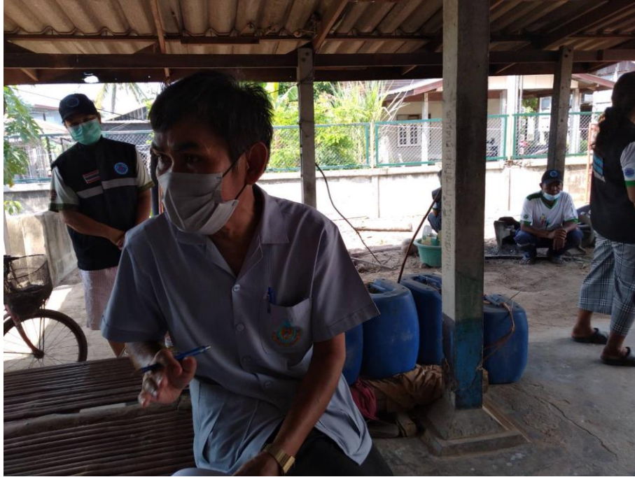
ภาพที่ 16 ผู้วิจัยใช้เครื่องมือแบบติดตามผู้ป่วยจิตเวชเรื้อรังในชุมชน 10 ด้านหลังการจัดอบรม