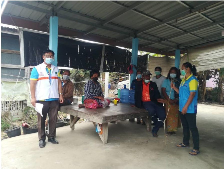
ภาพที่ 6 การสรุปผลและนัดหมายการเยี่ยมบ้านครั้งต่อไปโดยคณะผู้วิจัยและทีมสหสาขาวิชาชีพ