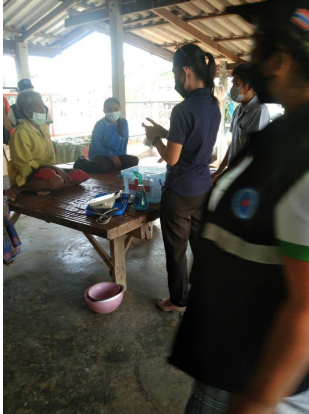
ภาพที่ 12 ผู้วิจัยสัมภาษณ์ครอบครัวผู้ป่วยเพิ่มเติมเพื่อการพัฒนากระบวนการดูแลผู้ป่วยจิตเภท