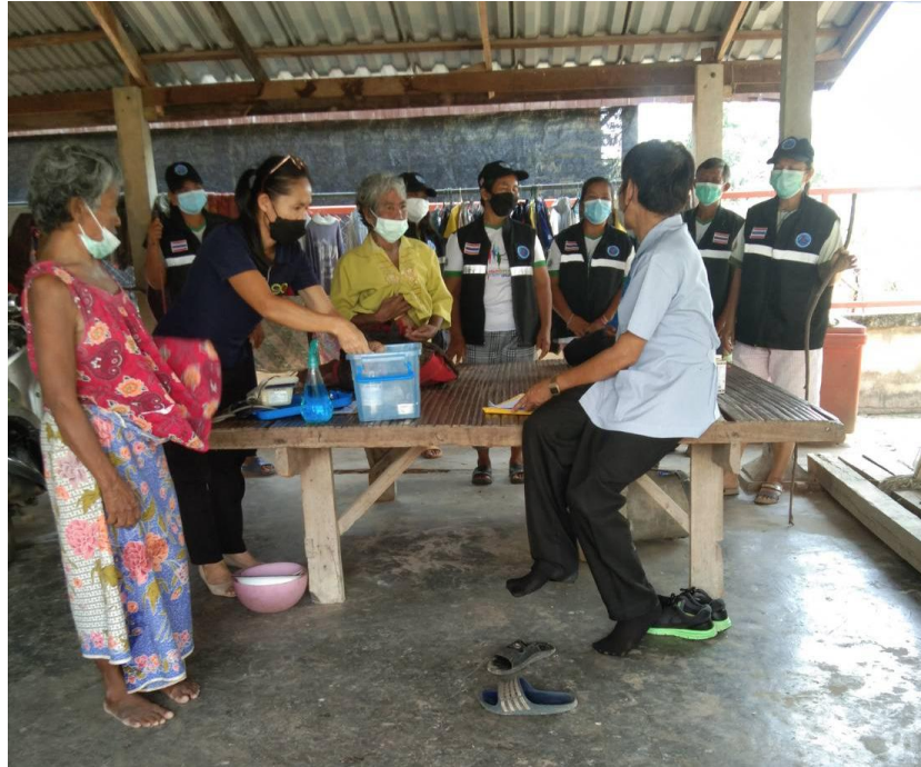
ภาพที่ 10 ผู้วิจัยร่วมกับทีมสหสาขาเครือข่ายผู้ดูแลในชุมชนวางแผนการดูแลผู้ป่วยจิตเภทเรื้อรังที่บ้าน