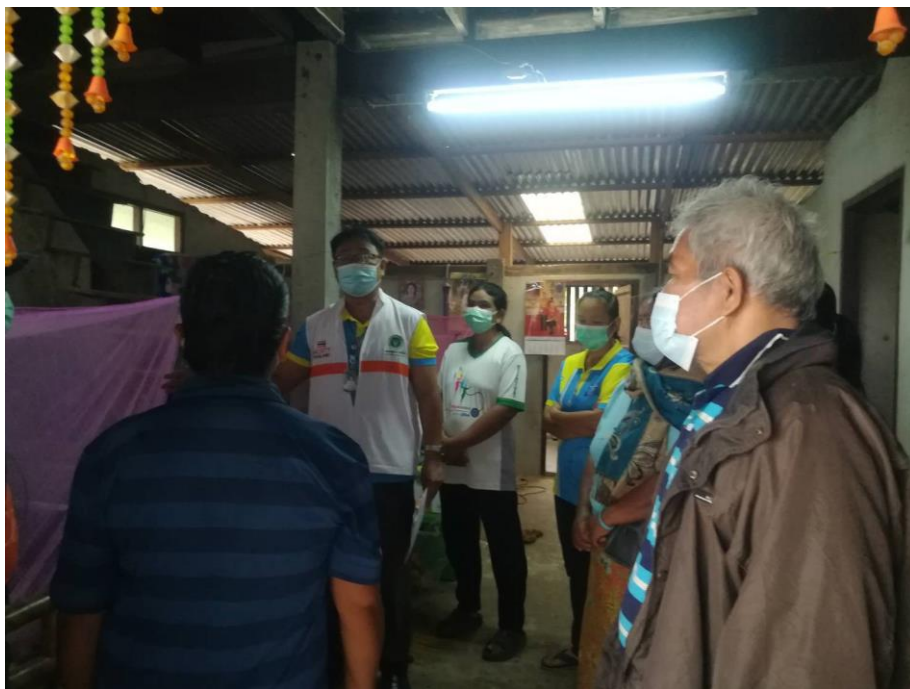
ภาพที่ 7 คณะผู้วิจัยและทีมสหสาขาวิชาชีพติดตามเยี่ยมบ้านผู้ป่วยจิตเภทรายอื่นร่วมกับเครือข่าย