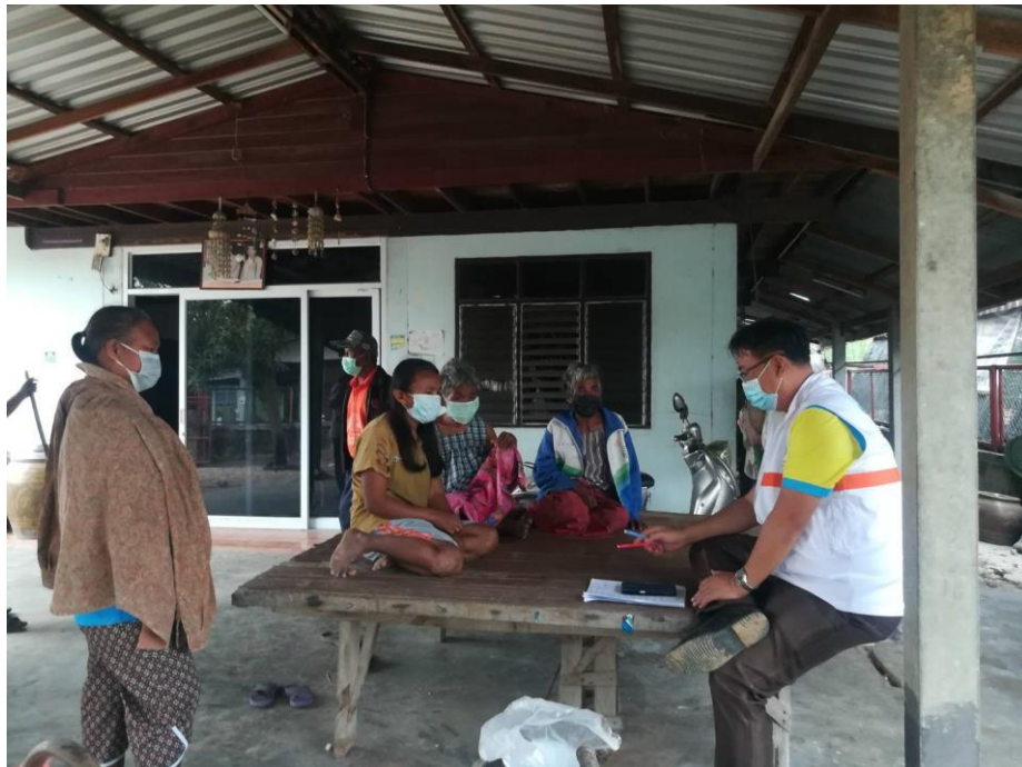
ภาพที่ 9 การสัมภาษณ์เชิงลึกผู้ป่วยจิตเภทและผู้ดูแลขณะเยี่ยมบ้านผู้ป่วยจิตเภท