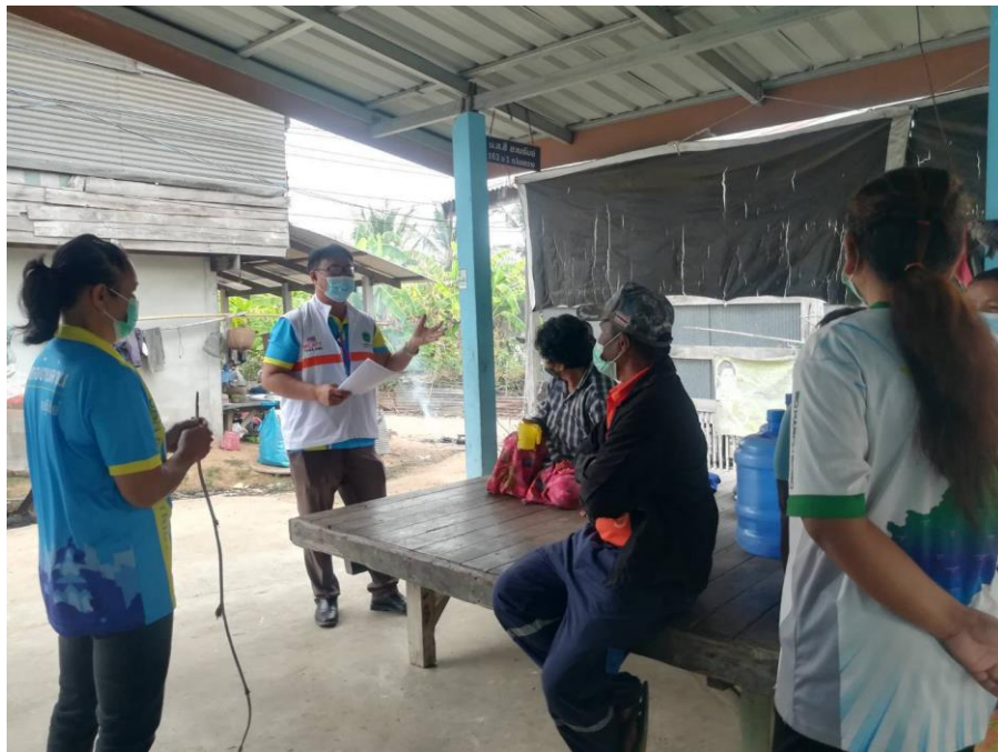
ภาพที่ 3 การสนทนากลุ่ม (Focus group) และการสัมภาษณ์เชิงลึก (In-depth interview) ระหว่างบุคคลสำคัญที่เกี่ยวข้องกับการให้การดูแลผู้ป่วยจิตเภทที่บ้าน