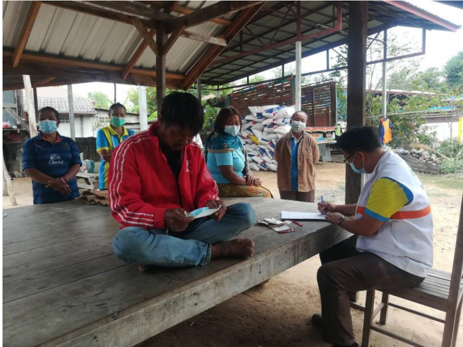
ภาพที่ 8 การตรวจประเมินสถานะผู้ป่วยจิตเภทและบันทึกผลรายงานขณะเยี่ยมบ้านผู้ป่วยจิตเภท