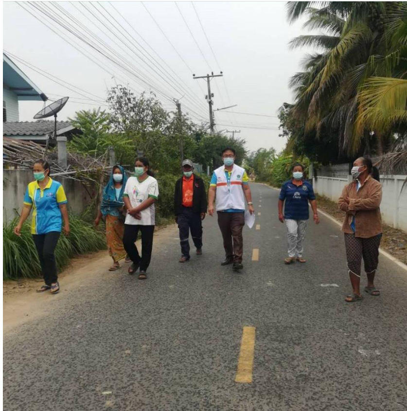
ภาพที่ 2 ผู้วิจัยร่วมกับ อสม. เดินสำรวจข้อมูลปัญหาและความต้องการของกลุ่มตัวอย่างในชุมชน