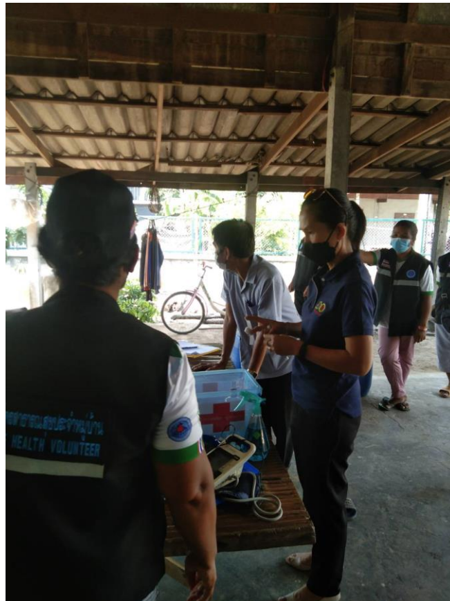
ภาพที่ 11 ผู้วิจัยสังเกตสภาพอนามัยสิ่งแวดล้อมประกอบแผนการดูแลผู้ป่วยจิตเภทเรื้อรังที่บ้าน