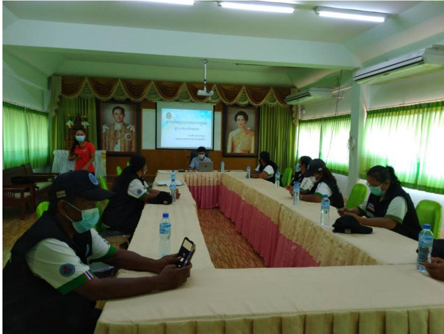
ภาพที่ 14 หลังการอบรมให้ความรู้การดูแลต่อเนื่องผู้ป่วยโรคจิตเภทร่วมกันตกลงติดตามประเมินผล