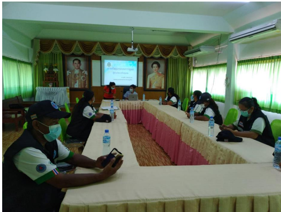
ภาพที่ 13 ผู้วิจัยจัดอบรมให้ความรู้การดูแลต่อเนื่องผู้ป่วยโรคจิตเภทแก่กลุ่มบุคคลสำคัญต่าง ๆ