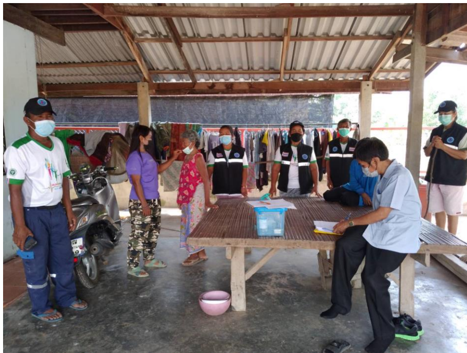
ภาพที่ 15 การติดตามประเมินผลภายหลังการจัดอบรมให้ความรู้การดูแลต่อเนื่องผู้ป่วยโรคจิตเภท