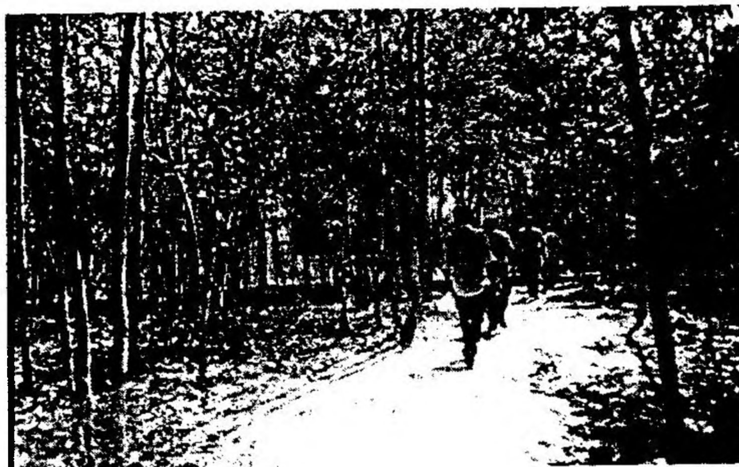
สำรวจพื้นที่ป่าชุมชนบ้านหนองเสม็ด