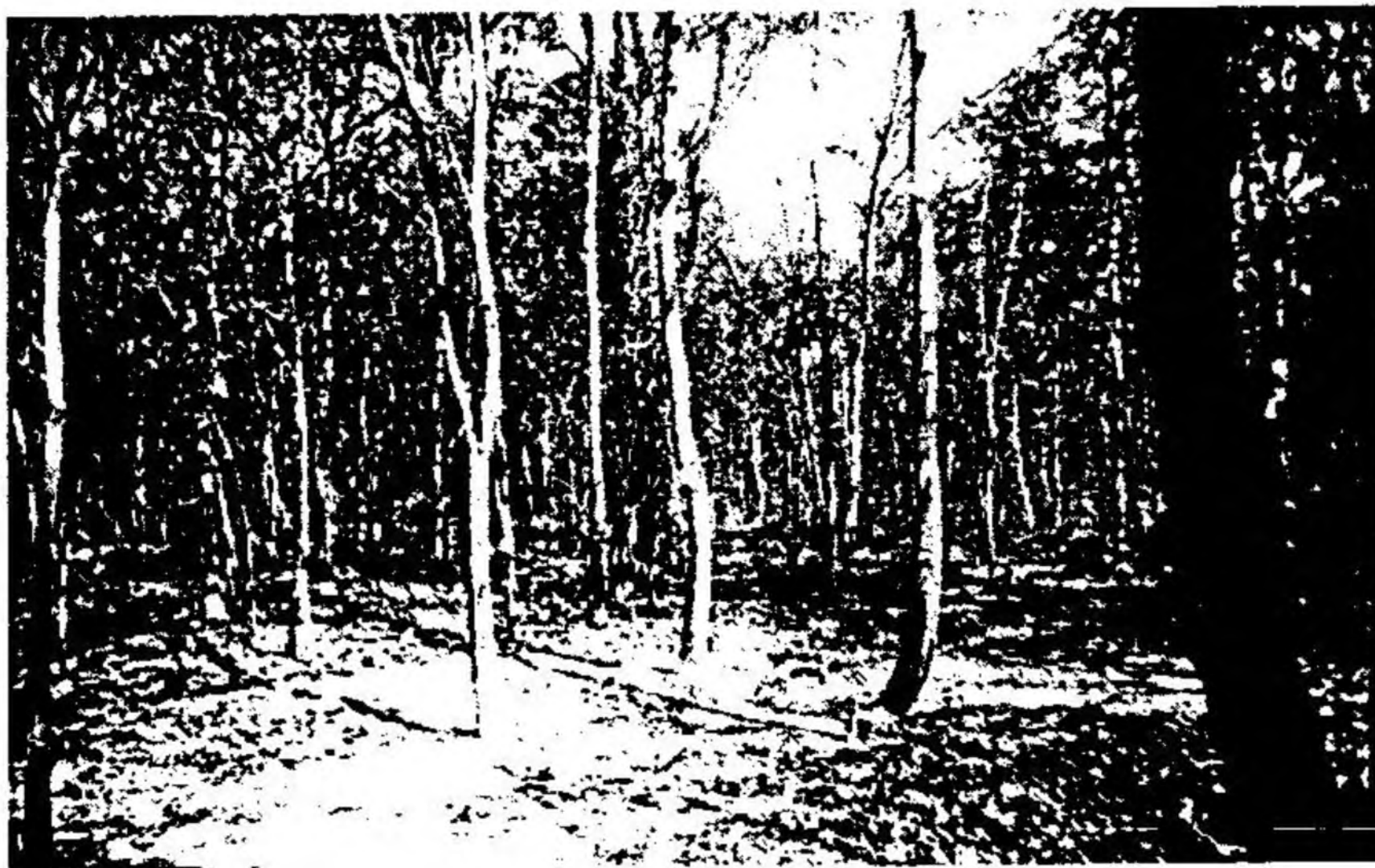
ไม้ที่ปลูกทดแทนป่าเสื่อมโทรม