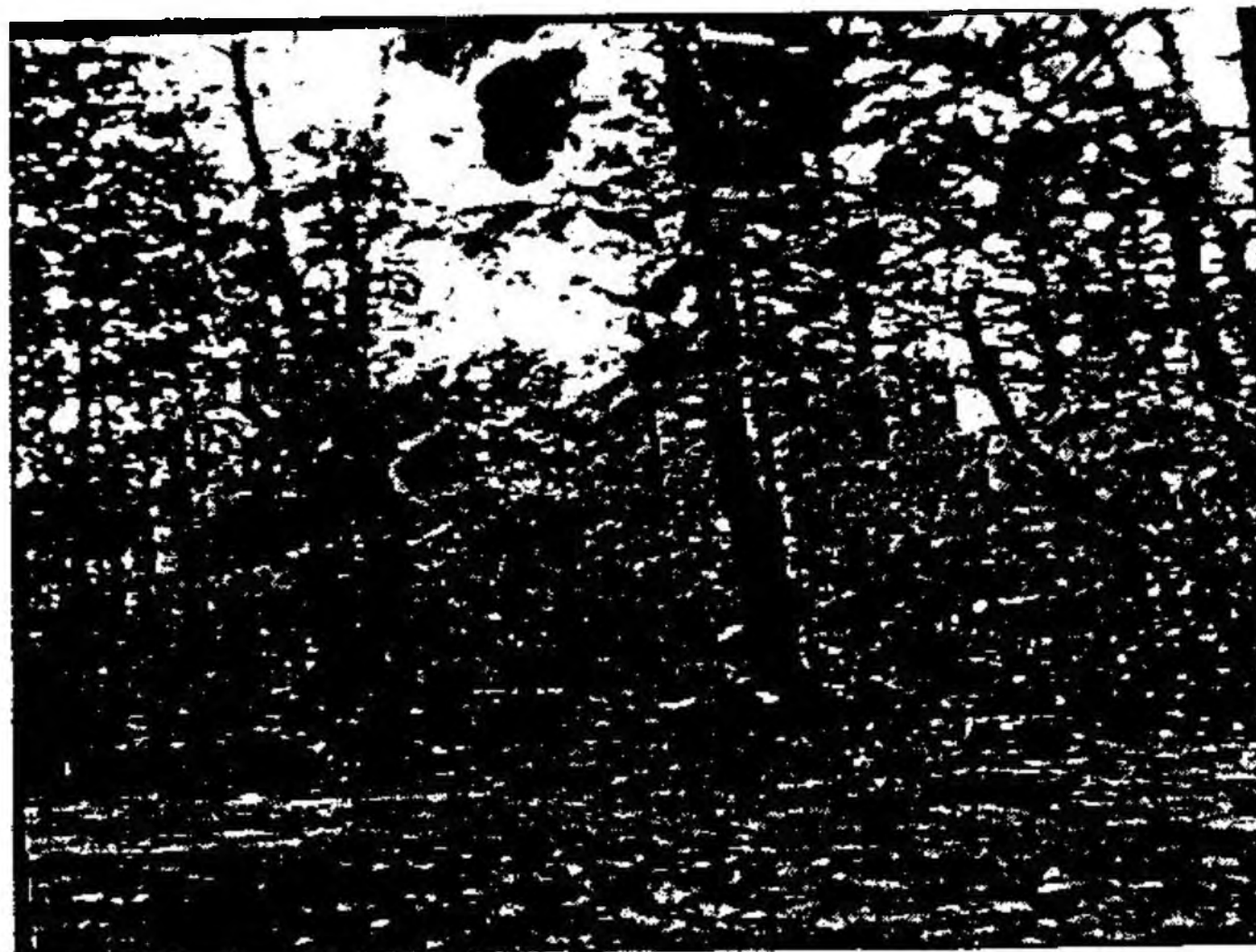
ความอุดมสมบูรณ์ของป่า