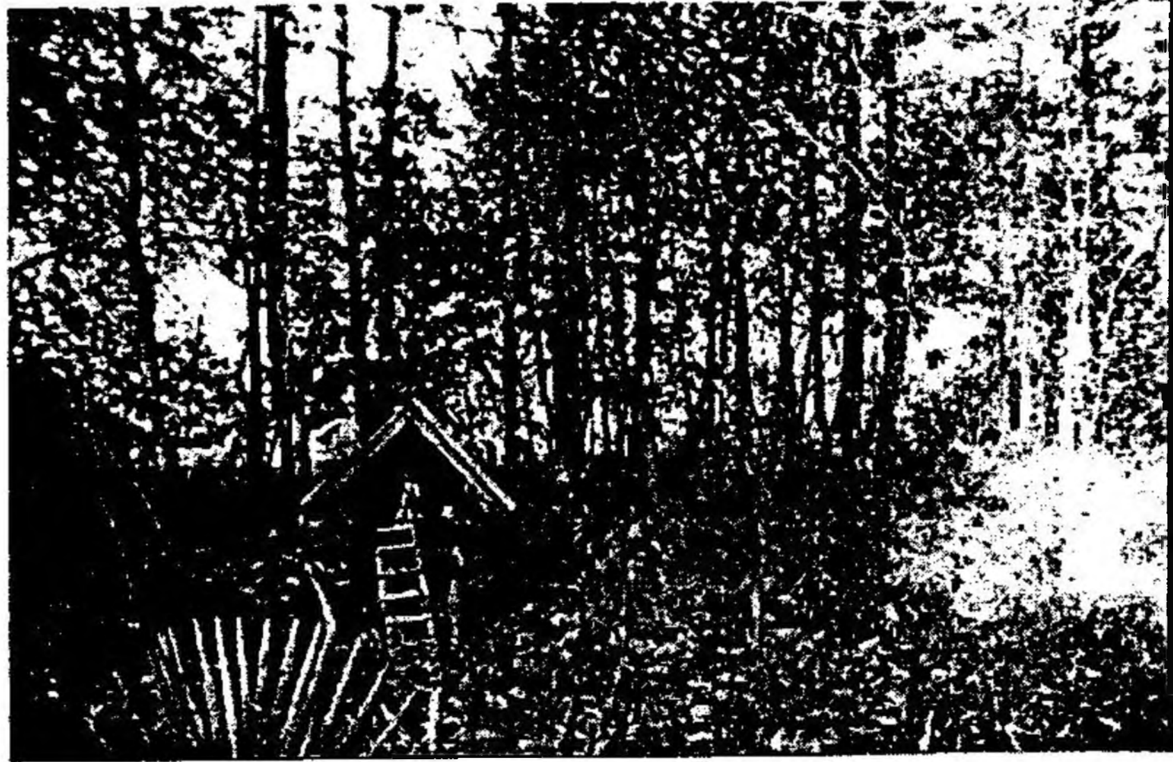
ศาลปู่ตา