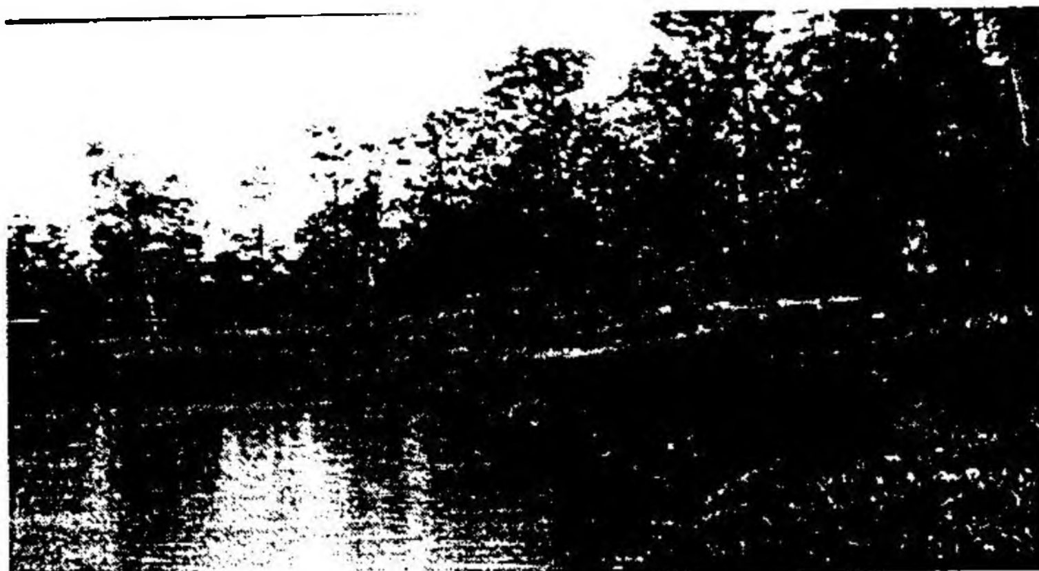
แหล่งน้ำในป่าชุมชน